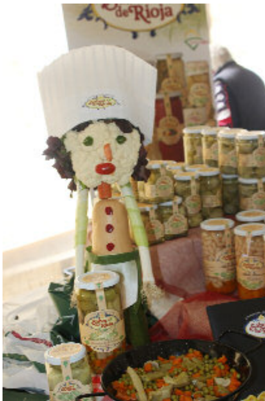
espárragos D.O., pimientos, etc.